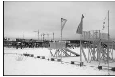
Детская площадка Энгри Бердс

На продолжении Суздальского проспекта от Выборгского шоссе до дороги на Каменку, протянувшегося на 3,5 километра, предстояло построить два путепровода: сначала над